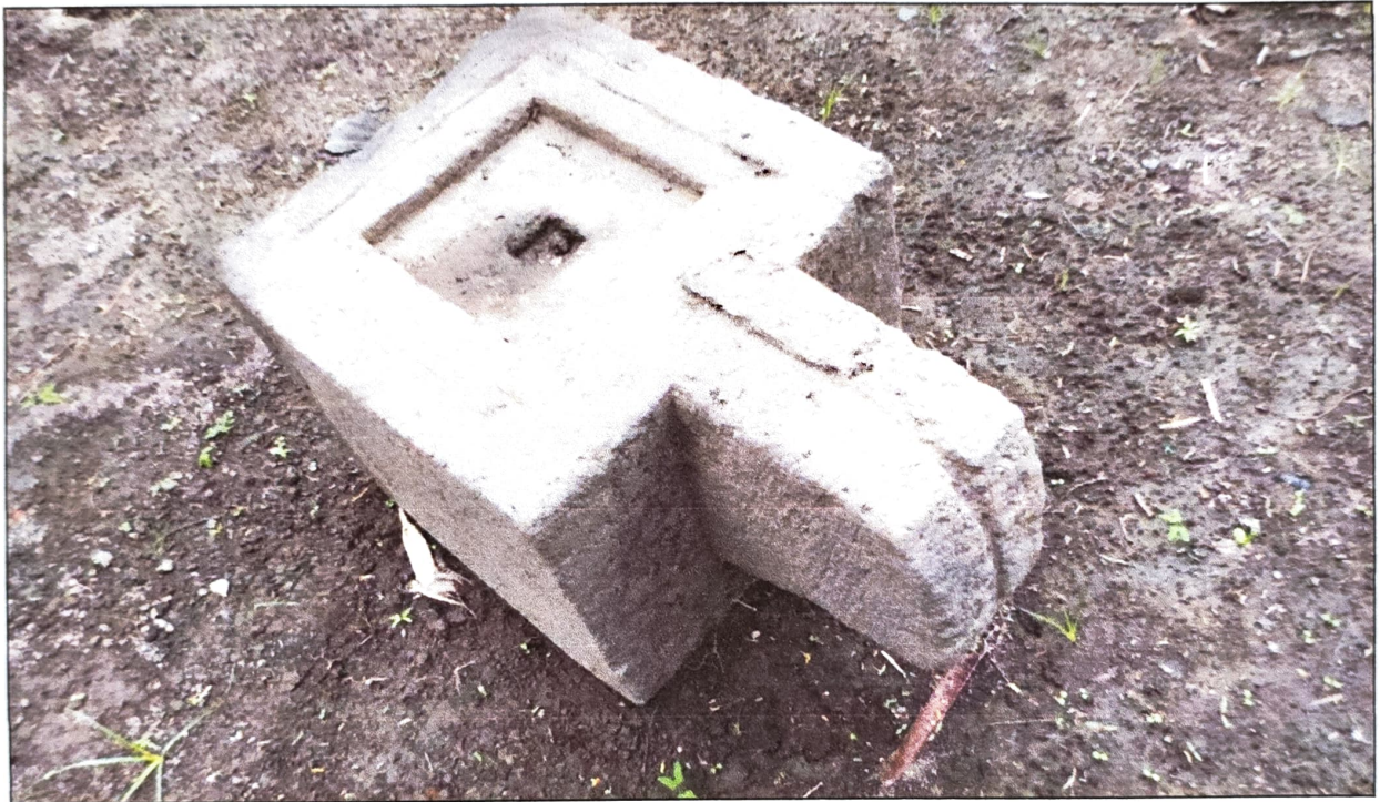
Gambar 1. Yoni Nomor Inventaris C 135.1 dilihat dari timur laut