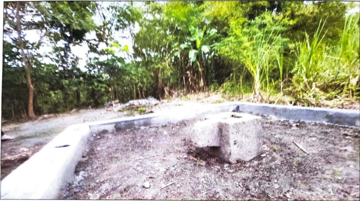
Gambar 2. Yoni Nomor Inventaris C 135.1 telah diberi pembatas keliling dilihat dari barat laut