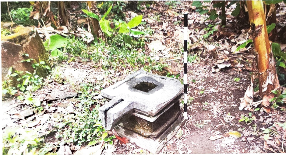
Gambar 1. Yoni Nomor Inventaris C 58.b dilihat dari barat laut