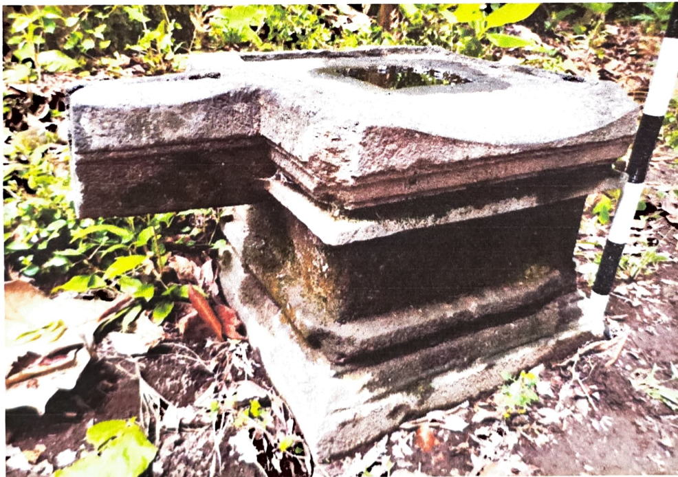
Gambar 4. Kenampakan bagian Yoni Nomor Inventaris C 58.b yang aus dilihat dari barat laut