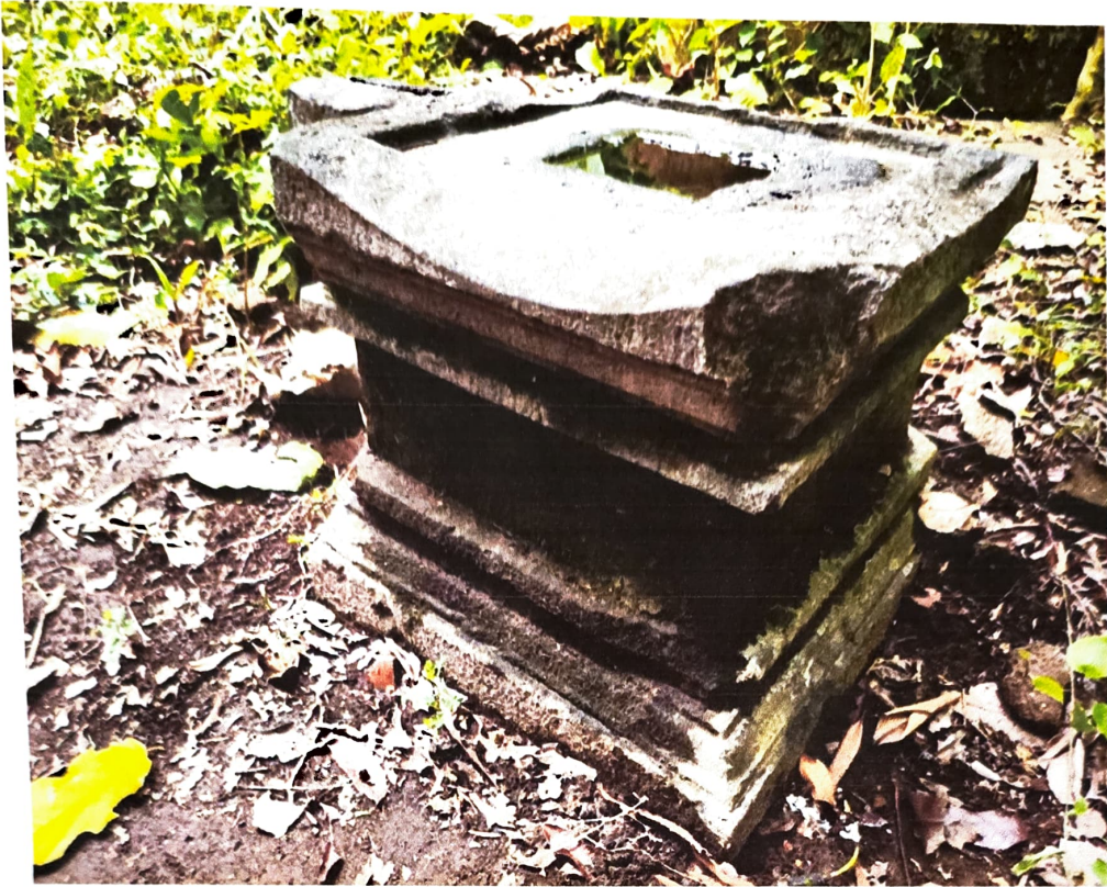
Gambar 5. Sudut Yoni Nomor Inventaris C 58.b yang aus dan gempil dilihat dari barat daya