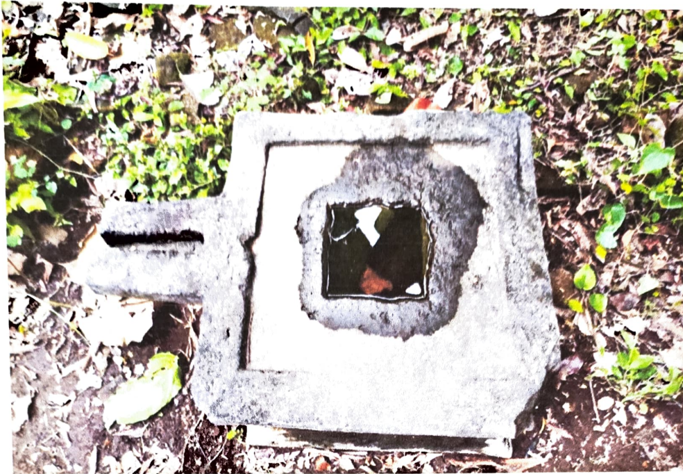
Gambar 3. Kenampakan Yoni Nomor Inventaris C 58.b dari atas