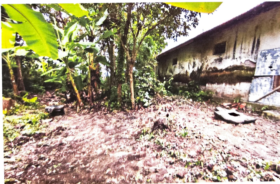
Gambar 2. Kondisi Yoni Nomor Inventaris C 58.b (kiri) saat ini. Di sebelah barat daya juga terdapat sebuah Yoni Nomor Inventaris 58.a