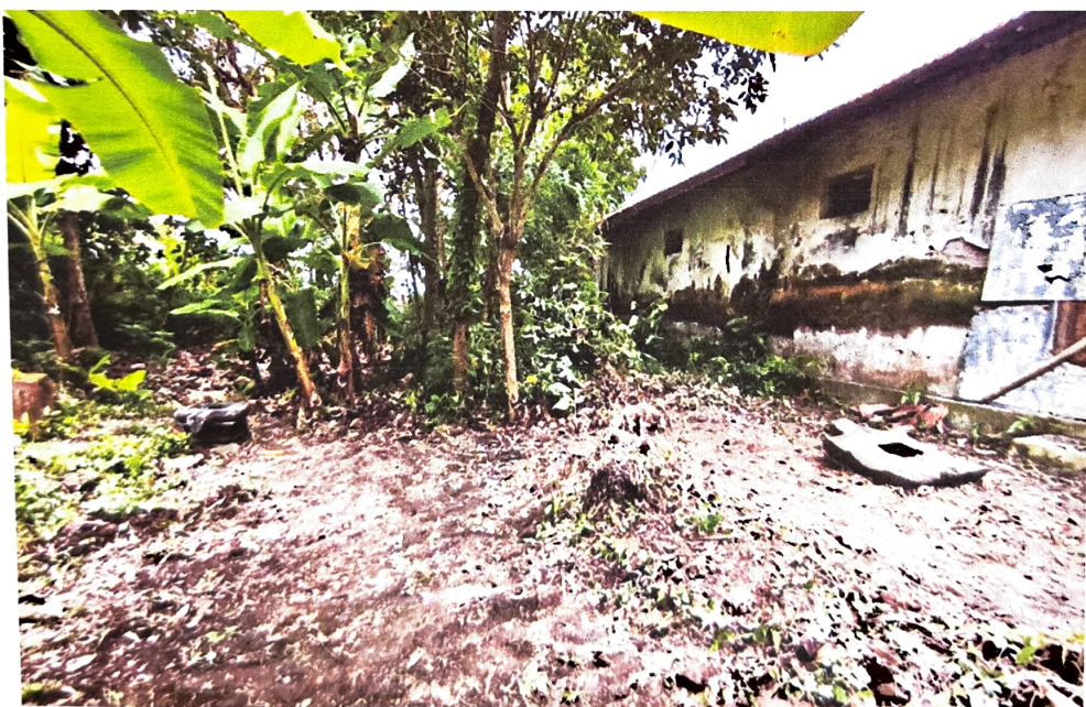
Gambar 4. Kondisi Yoni Nomor Inventaris C 58.a saat ini. Di sebelah tenggara juga terdapat sebuah yoni yang lebih kecil