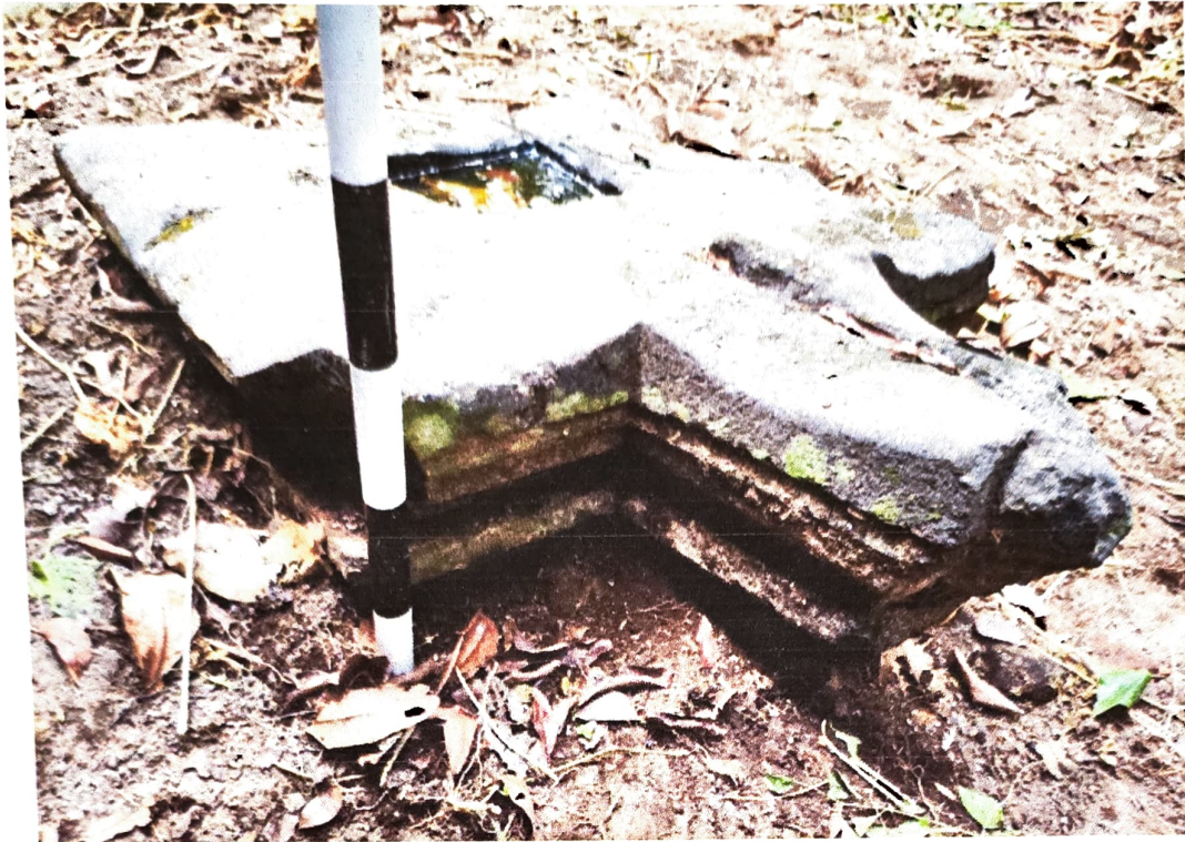
Gambar 5. Kondisi Yoni Nomor Inventaris C 58.a sebagian masih terpendam dalam tanah