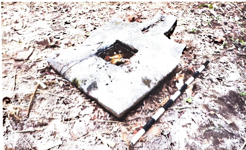
Gambar 2. Bagian atas Yoni Nomor Inventaris C 58.a dilihat dari barat laut