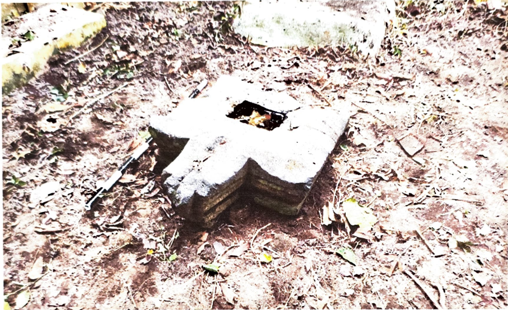
Gambar 1. Yoni Nomor Inventaris C 58.a dilihat dari tenggara