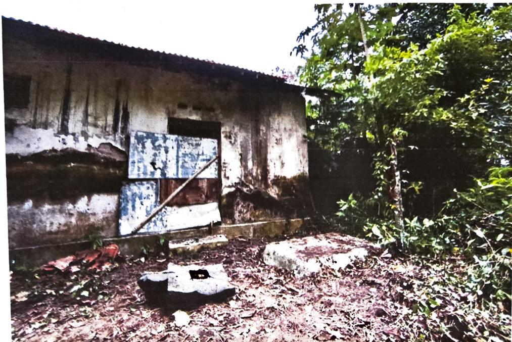
Gambar 3. Kondisi Yoni Nomor Inventaris C 58.a dilihat dari timur