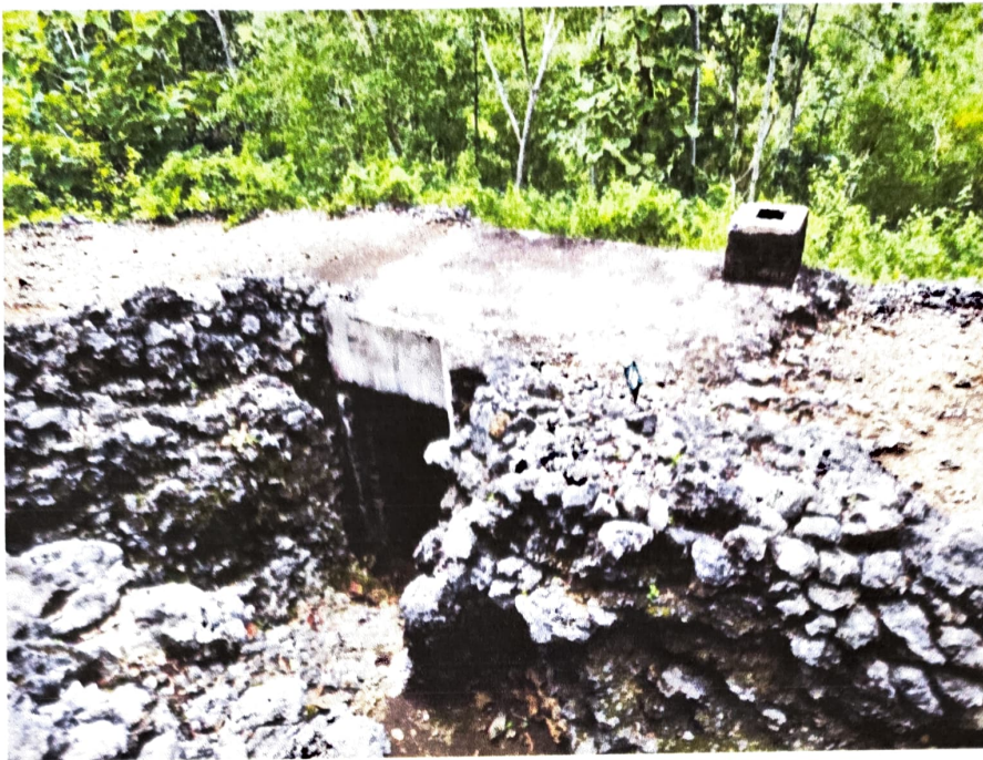
Gambar 2. Gua Jepang Nomor 18 dalam Lokasi Goa Jepang Bukit Doklumut dilihat dari barat laut