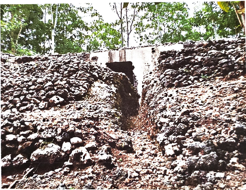
Gambar 1. Lubang pintu masuk Gua Jepang Nomor 17 dalam Lokasi Goa Jepang Bukit Doklumut dilihat dari barat