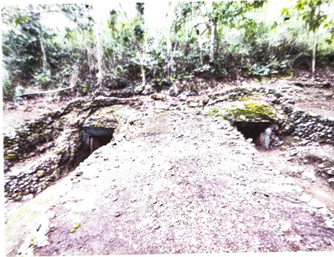
Gambar 1. Gua Jepang Nomor 15 dalam Lokasi Goa Jepang Lembah Doklumut dilihat dari timur