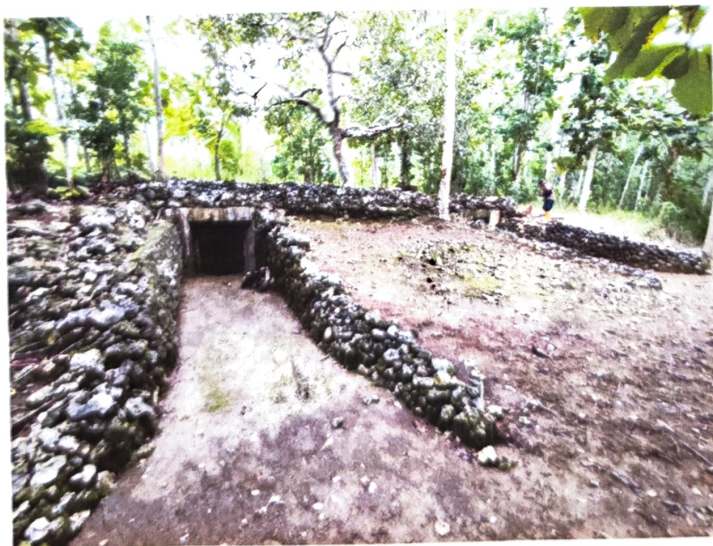
Gambar 2. Gua Jepang Nomor 16 dalam Lokasi Goa Jepang Lembah Doklumut dari arah barat laut