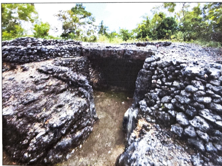
Gambar 2. Gua Jepang Nomor 14 dalam Lokasi Goa Jepang Bukit Ngancar dilihat dari timur laut