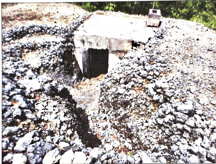
Gambar 1. Gua Jepang Nomor 13 dalam Lokasi Goa Jepang Bukit Ngancar dilihat dari barat daya