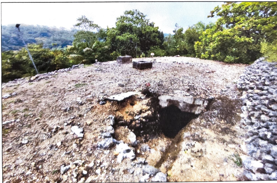
Gambar 2. Gua Jepang Nomor 9 dalam Lokasi Goa Jepang Bukit Gunungwesi dilihat dari timur laut