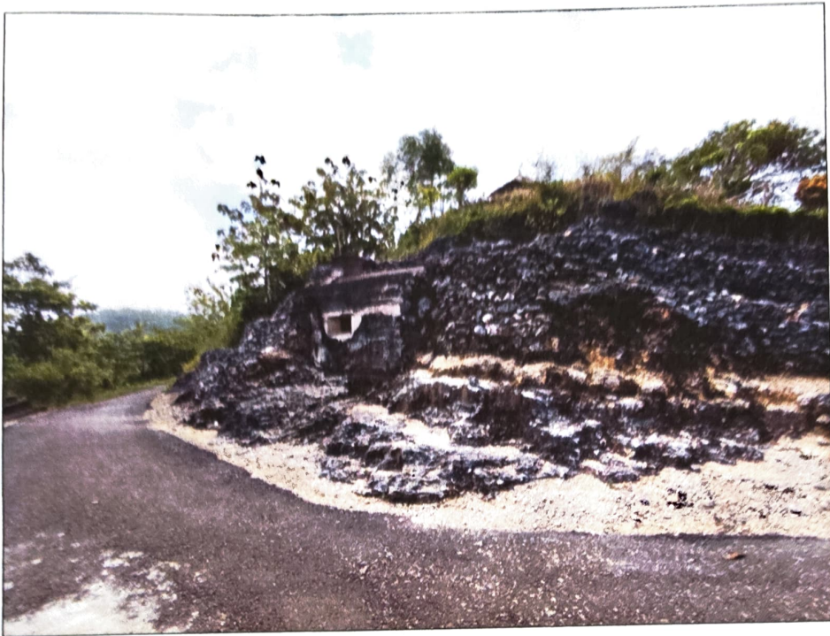
Gambar 3. Gua Jepang Nomor 10 dalam Lokasi Goa Jepang Bukit Gunungwesi dari arah barat daya