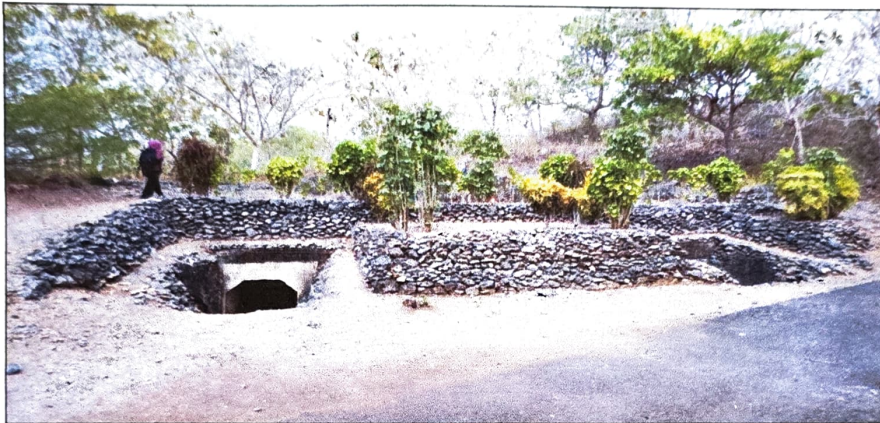
Gambar 1. Gua Jepang Nomor 8 dalam Lokasi Goa Jepang Bukit Gunungwesi tampak dari arah utara