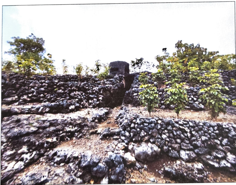
Gambar 4. Gua Jepang Nomor 11 dalam Lokasi Goa Jepang Bukit Gunungwesi dari arah timur laut