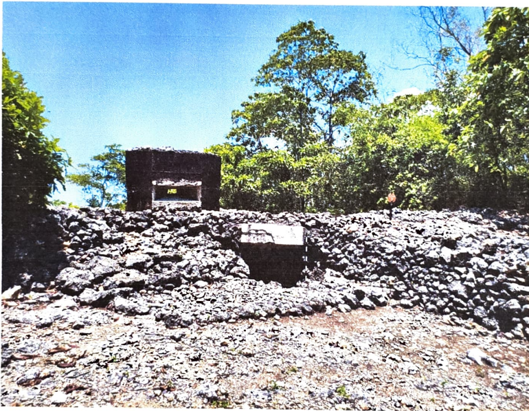
Gambar 3. Ruang atas bangunan Gua Jepang Nomor 7 dalam Lokasi Goa Jepang Bukit Mrangi dari arah barat