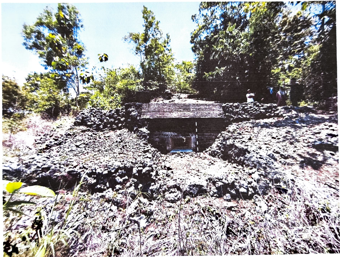
Gambar 1. Gua Jepang Nomor 5 dalam Lokasi Goa Jepang Bukit Mrangi tampak dari arah timur