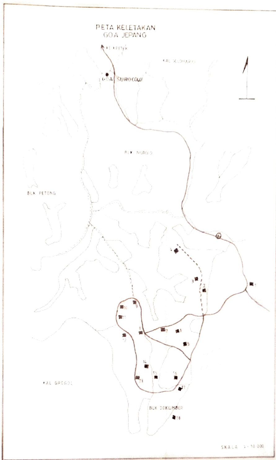
Gambar 4. Denah keletakan Lokasi Gua Jepang Nomor 5, Gua Jepang Nomor 6, dan Gua Jepang Nomor 7 dalam Lokasi Goa Jepang Bukit Mrangi