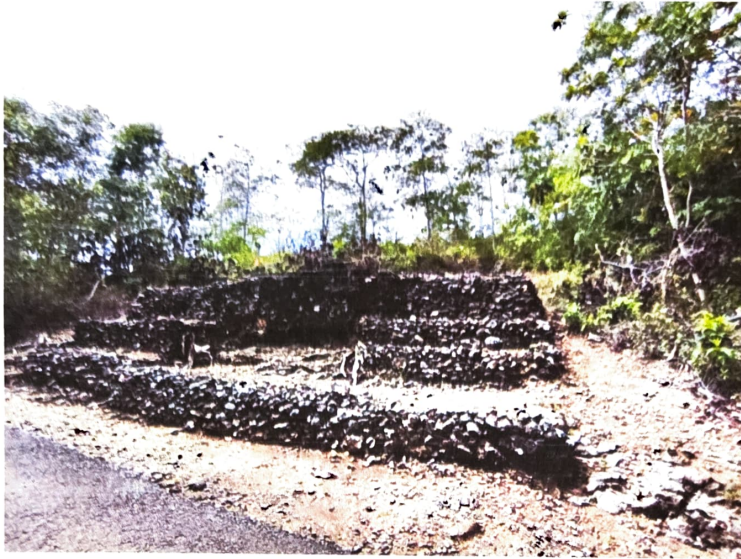
Gambar 2. Gua Jepang Nomor 6 dalam Lokasi Goa Jepang Bukit Mrangi dilihat dari utara