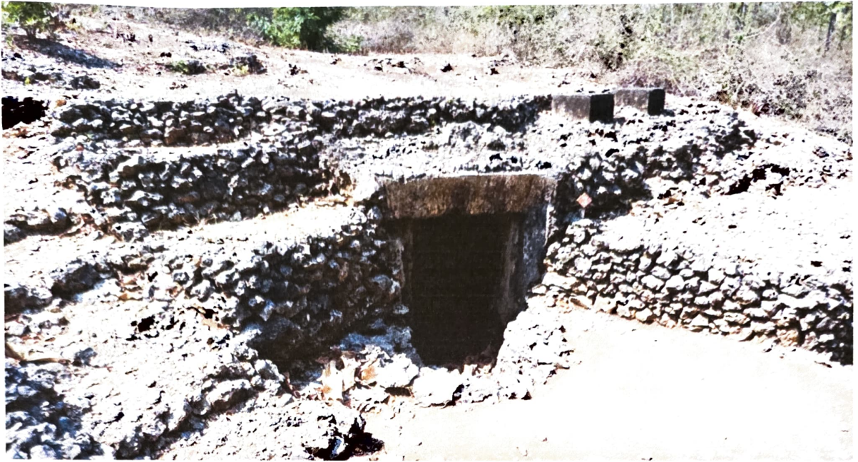
Gambar 2. Gua Jepang Nomor 3 dalam Lokasi Goa Jepang Bukit Durparang dilihat dari utara