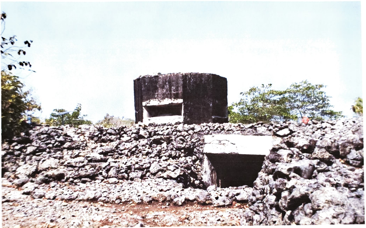
Gambar 1. Struktur atas Gua Jepang Nomor 2 dalam Lokasi Goa Jepang Bukit Durparang dilihat dari arah timur