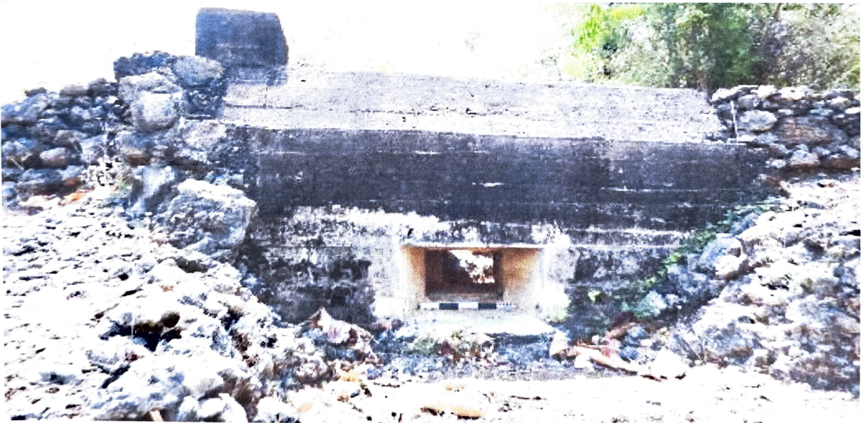
Gambar 3. Struktur Gua Jepang Nomor 4 dalam Lokasi Goa Jepang Bukit Durparang dilihat dari barat