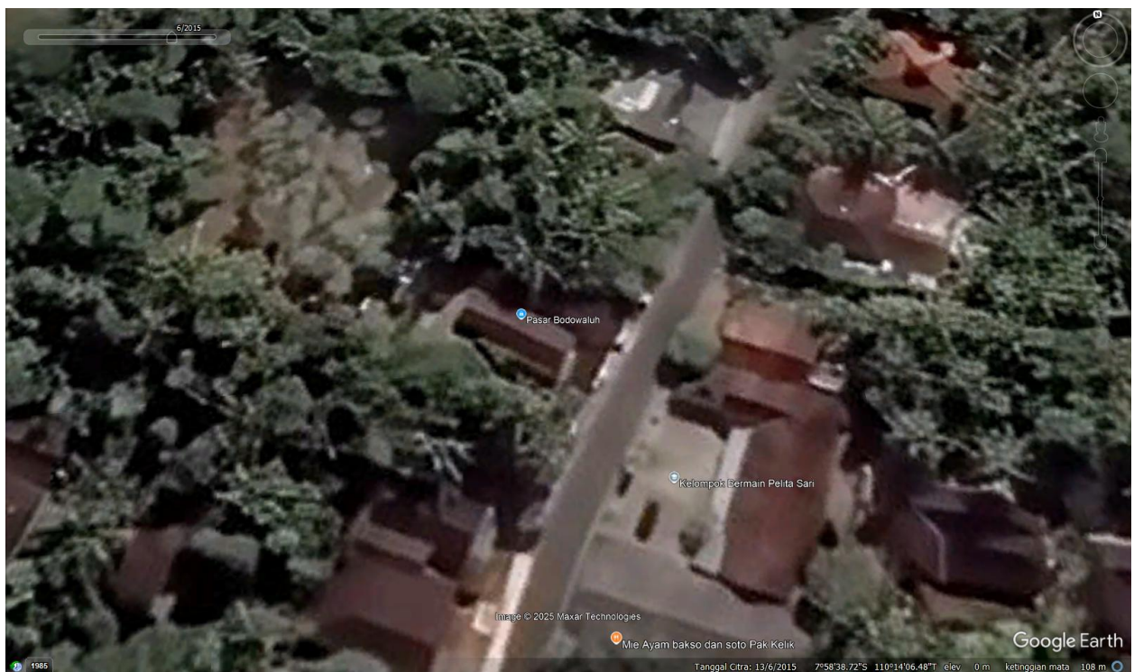
Keadaan Pasar Koripan 2015 (tertulis di peta Pasar Bodowaluh)