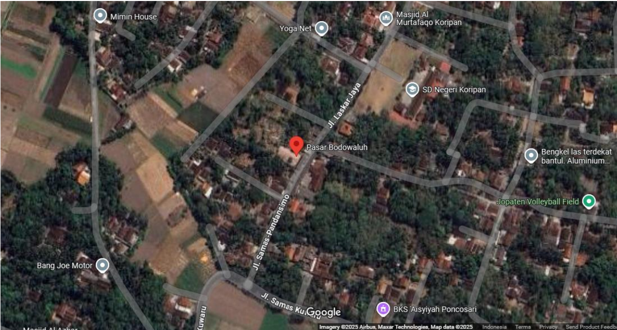
Lokasi Los Lama Pasar Koripan (tertulis di peta Pasar Bodowaluh)