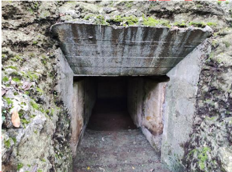
Gambar 4. Lubang pintu selatan Gua Jepang Nomor 15 dilihat dari timur.