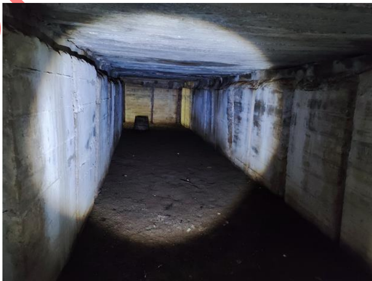
Gambar 5. Ruang bagian dalam Gua Jepang Nomor 15 dilihat dari utara