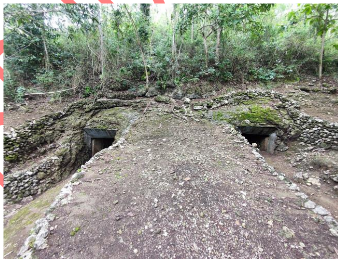
Gambar 2. Gua Jepang Nomor 15 U dilihat dari timur (Sumber: TACB Bantul, 2024)