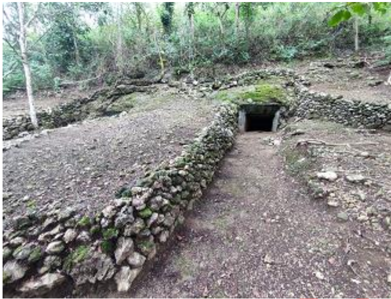
Gambar 3. Jalur masuk lubang pintu utara Gua Jepang Nomor 15 dilihat dari timur.