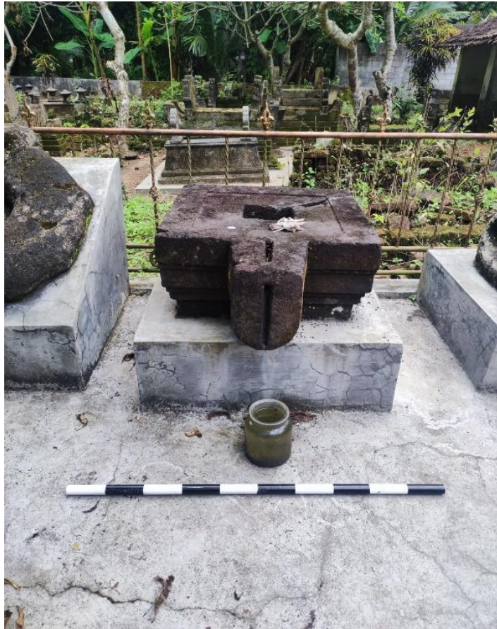
Gambar 1. Yoni (Nomor Inventaris C.102 i) di Makam Kembang Padukuhan Mangir Lor, Kalurahan Sendangsari, Kapanewon Pajangan, Kabupaten Bantul