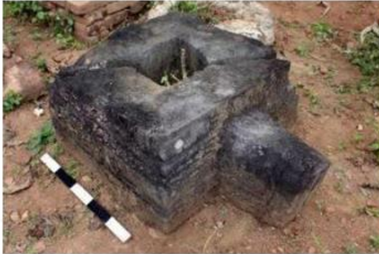
Gambar 3. Yoni Nomor Inventaris C.102 i dengan skala saat kegiatan Her-Inventarisasi Cagar Budaya