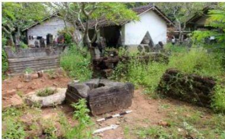
Gambar 4. Kondisi Yoni Nomor Inventaris C.102 i saat kegiatan Her-Inventarisasi Cagar Budaya