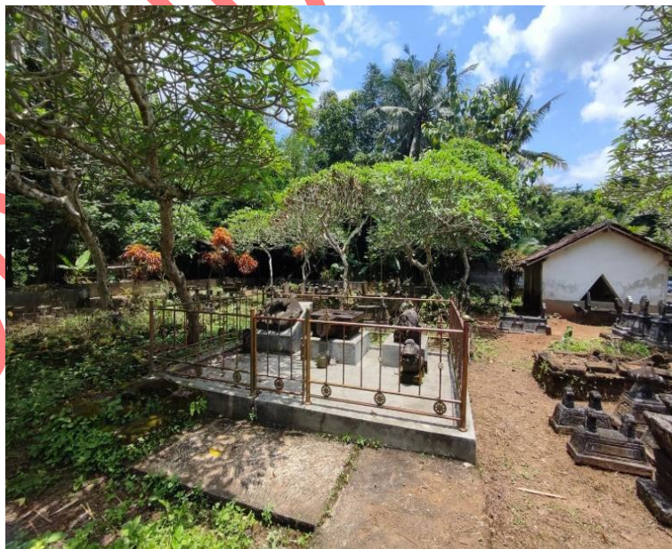
Gambar 2. Kondisi Yoni Nomor Inventaris C.102 i saat ini