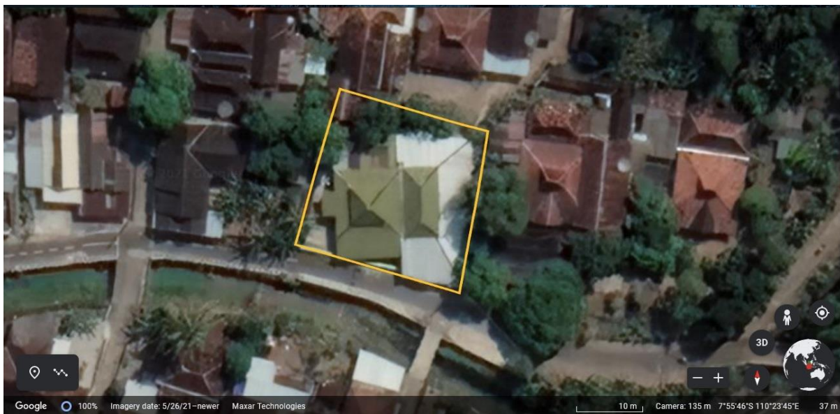
Denah Masjid Banyusumurup