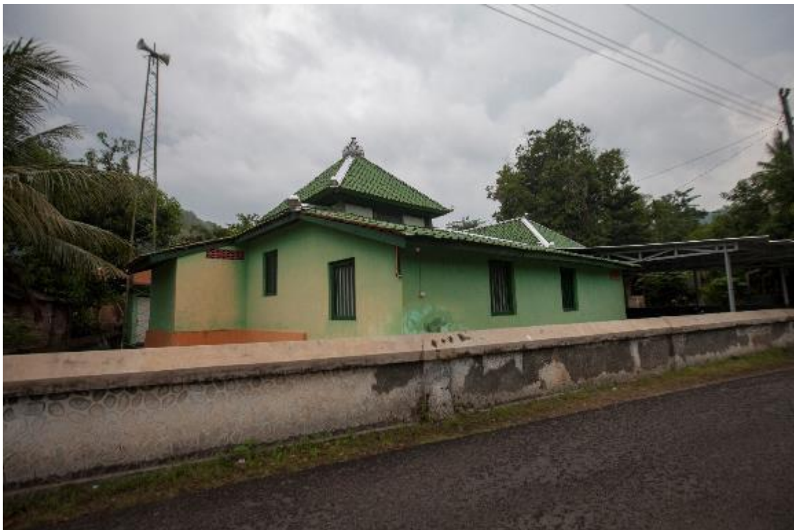
Situasi Masjid Banyusumurup dilihat dari barat daya