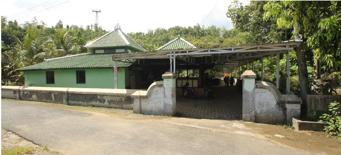
Masjid Banyusumurup dilihat dari arah tenggara