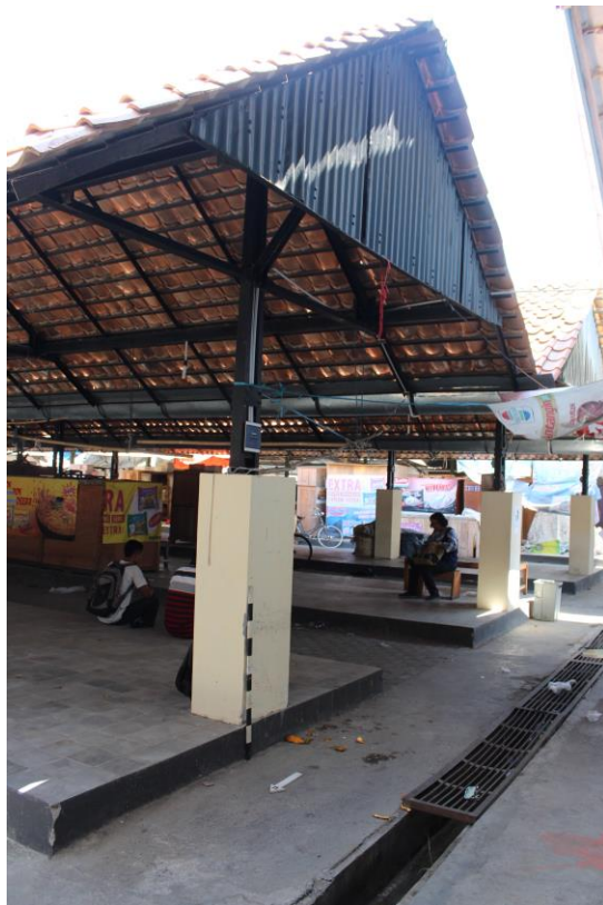
Foto bangunan yang telah direnovasi