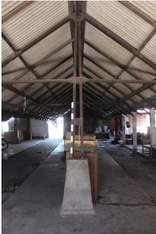
Bangunan Pasar Gatak yang masih asli