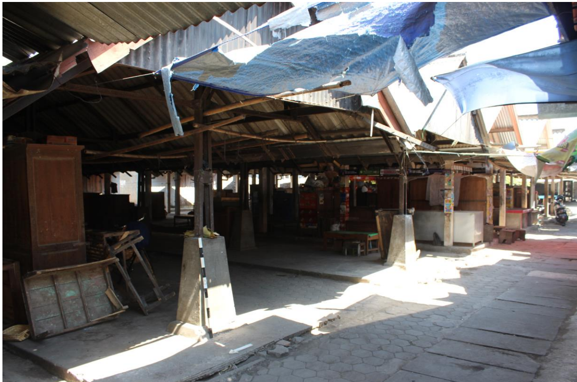
Bangunan Pasar Gatak