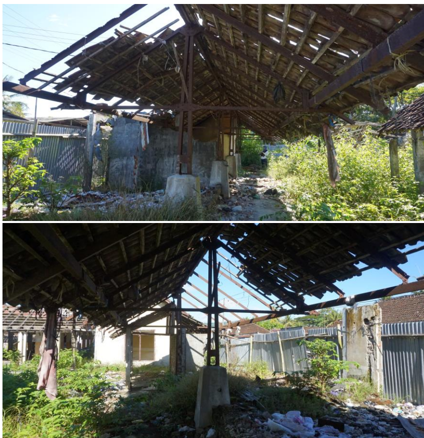
Bangunan Pasar Angkrusari (Foto: TACB Kab. Bantul, 2018)