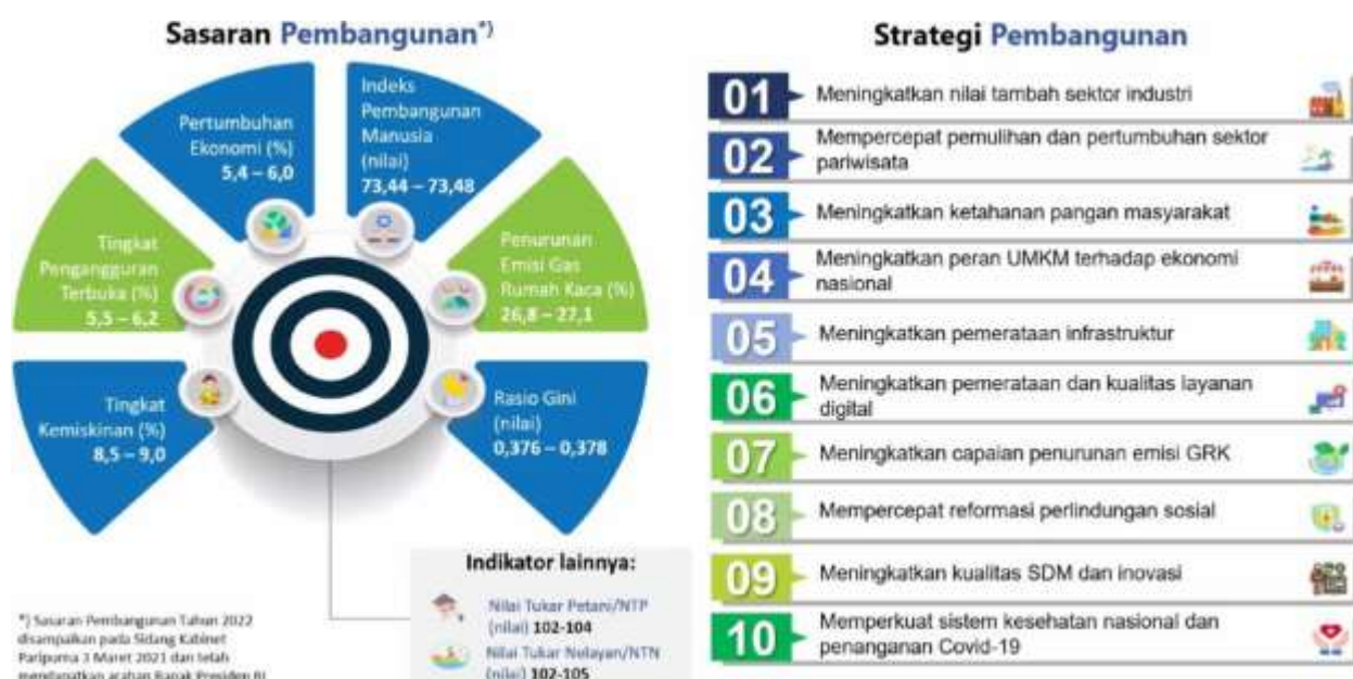
Gambar 3.2 Sasaran dan Strategi Pembangunan RKP 2022

Dalam rangka mendukung pencapaian tema RKP 2022 maka ditetapkan sasaran dan strategi RKP 2022 sebagai berikut: