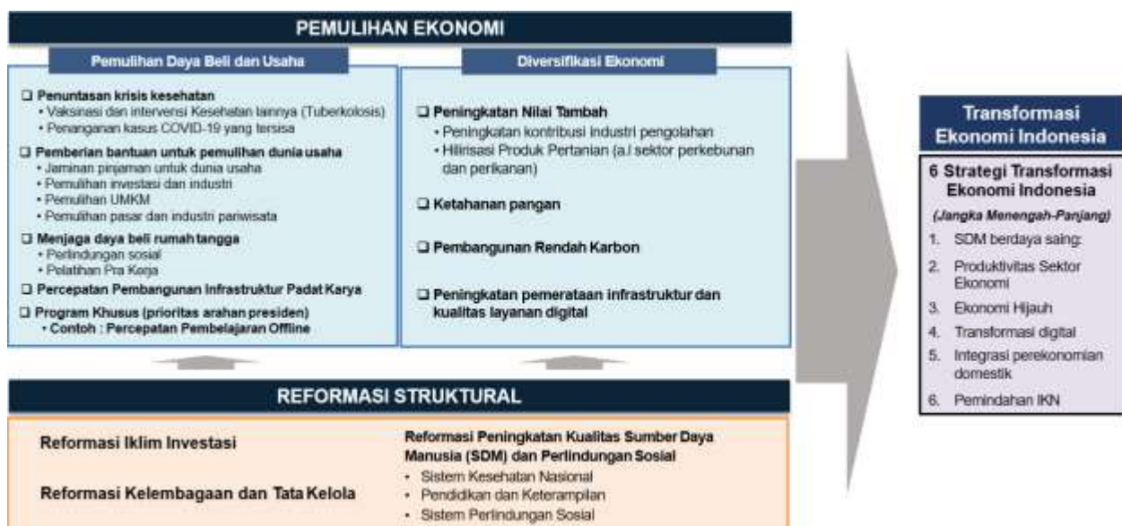
Gambar 3.1 Kerangka Pikir RKP 2022